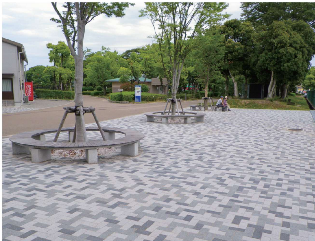
●ST-N型 H10・H11・H12【I L T】