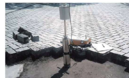
小型FWDによる舗装体支持力調査