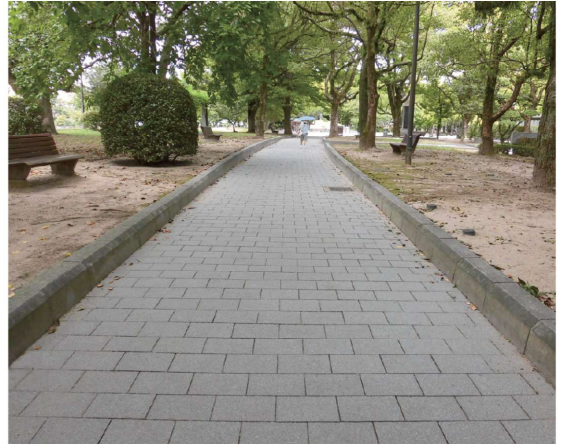
●ST-A型 白御影石【KBシリーズ】