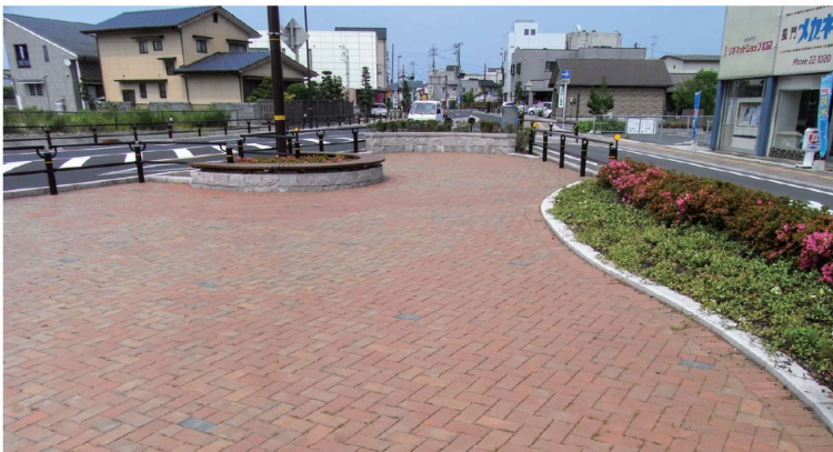
●コロポリー・ヘイズ ■高質空間整備（長門市）

オーストラリア大地の自然の土が生み出す多彩な表情に加え、焼き物特有の黒変がさらに深い変化を与えています。