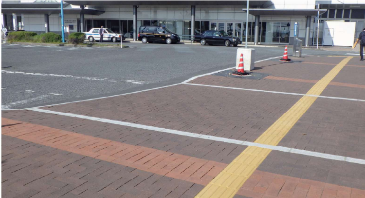
●ネオブラック・ネオヘイズ ※周南市から出る廃材をリサイクル原料としたれんがです。 ■徳山駅南口広場（周南市）

リサイクル率50%以上で環境にやさしい舗装用れんがです。原料には都市廃材も使用可能で、都市リサイクルシステムの構築が可能です。