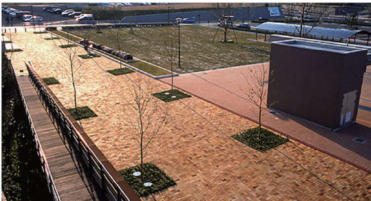
■いのちのたび博物館（福岡県北九州市）

高熱の歳月を経た使用済み耐火れんがならではの渋い味わい、自然な感触・風合いががもたす限りない奥行きが好評です。組積と舗装用に対応可能です。