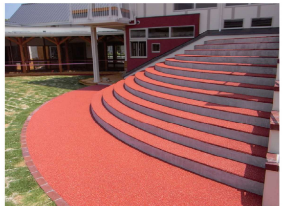
■平川保育所（山口市）