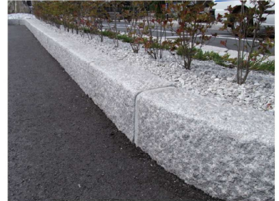
■長門市駅前広場（長門市）