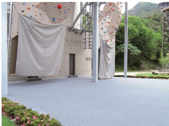
■山口県セミナーパーク クライミング場（山口市）