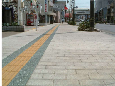
■北浜通りシンボルロード（福山市）