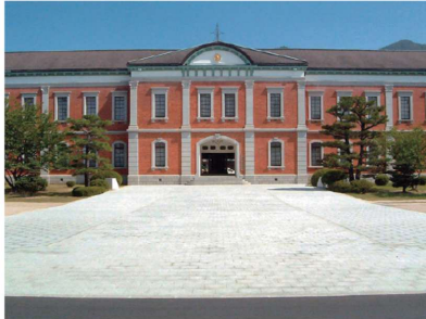
■海上自衛隊（江田島市）