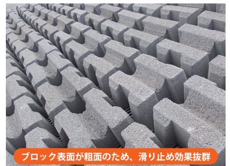
ブロック表面が粗面のため、滑り止め効果抜群