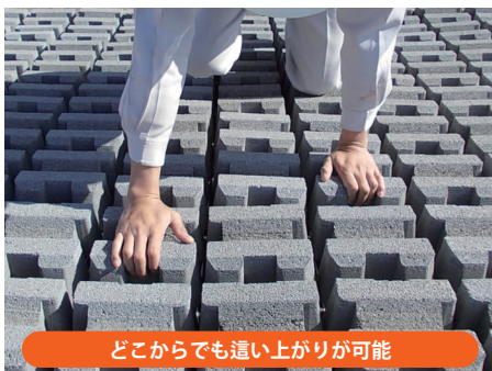
どこからでも這い上がりが可能